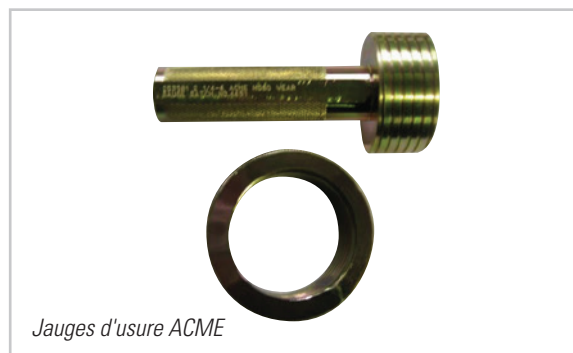
Jauges d'usure ACME

Commandez vos jauges d'usure ACME auprès de l'un de nos centres ci-dessous!