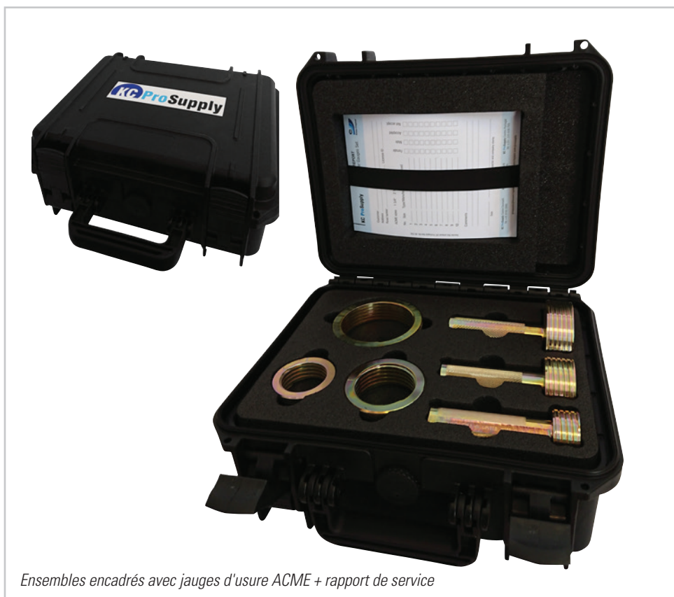
Ensembles encadrés avec jauges d'usure ACME + rapport de service